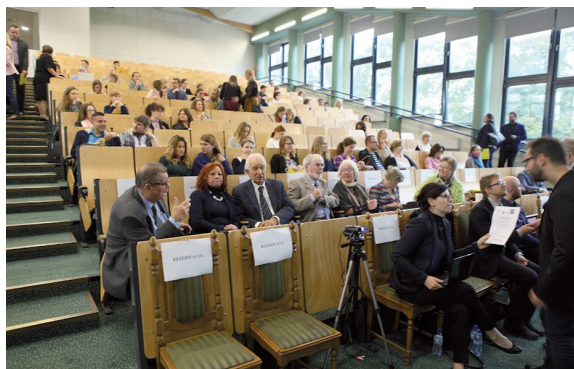
Uczestnicy konferencji oraz zaproszeni goście