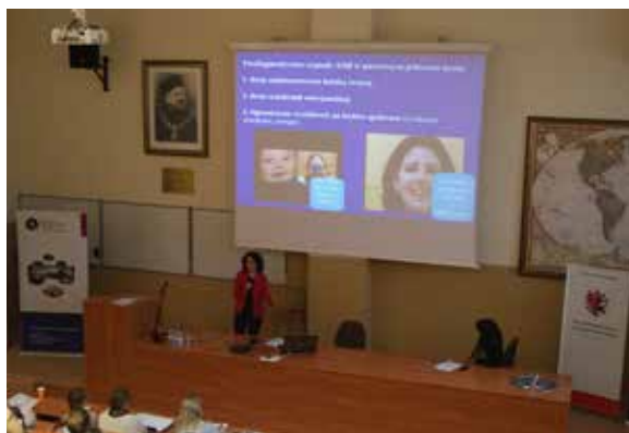
W trakcie konferencji podzielonej na część wykładową i warsztatową można było zapoznać się z najnowszymi tendencjami w diagnostyce i terapii osób z zaburzeniami ze spektrum autyzmu

Konferencja (zarówno obrady, jak i warsztaty) była poświęcona komunikacji, mowie i językowi osób z zaburzeniami ze spektrum autyzmu, z uwagi na fakt, że ograniczenia komunikacji lub jej zupełny brak to główne czynniki zaburzające prawidłowe funkcjonowanie społeczne takich osób. Odpowiednia wczesna diagnoza i właściwie dobrane metody pracy mogą prowadzić do zmniejszenia nasilenia i zakresu występujących zaburzeń.