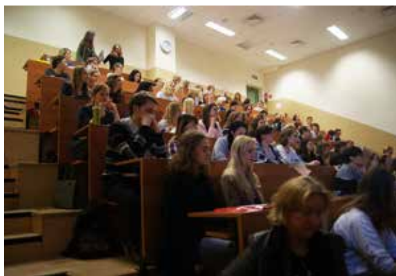
W konferencji wzięło udział ponad 100 osób. Obecni byli na niej specjaliści zarówno z województwa kujawsko-pomorskiego, jak i spoza regionu